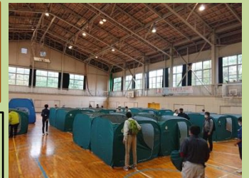
↑ワンタッチテント設置の様子↓