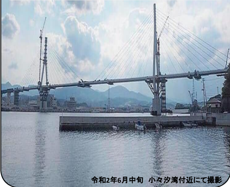
令和2年6月中旬 小々汐湾付近にて撮影

ついに2つの橋脚が繋がりましたね！気仙沼湾を横断する全長1344mの橋で、最後の橋桁を設置する工事が5月に行われ段差も徐々に解消されてきました。年内にも完成する予定みたいです。開通が楽しみです☆