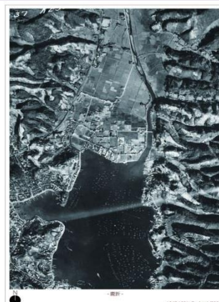
1947年の鹿折地区の航空写真

鹿折まちづくり協議会では協議会の設立10周年を記念した活動記録誌の作成を計画しており、誌面に使用する「昔の鹿折の写真(東日本大震災以前の写真)」の提供を住民のみなさまからお願いしたいと考えています。今秋頃、写真をお持ち寄りいただいでみんなで語り合うサロンの開催を予定しております。写真の提供はその際にご相談させていただきたいと思ひます。みなさまのご協力をよろしくお願いいたひます。