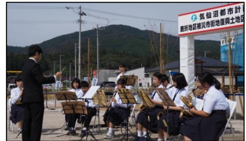
小々汐うちばやし保存会(写真左)と鹿折中学校吹奏楽部(写真右)のみなさんによる祝演がおこなわれました