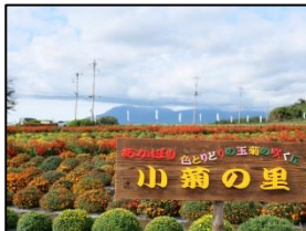
商店街の視察研修事業で「あかぼり小菊の里」を訪れました