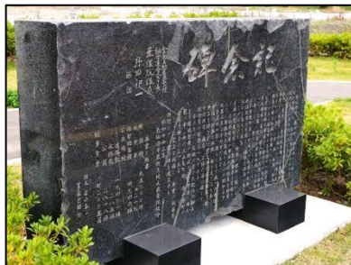
BRT鹿折唐桑駅前に建立された記念碑

鹿折地区における土地区画整理事業は、東日本大震災以前にも行われています。それを記した石碑が、現在BRT鹿折唐桑駅前の広場に建立されています。この石碑は、昭和38年から42年にかけて行われた鹿折地区土地区画整理事業の概要を記録した記念碑です。