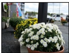
かもめ通り商店街に並んでいる小菊(10月下旬)